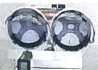
「熱ボウシ」なし測定