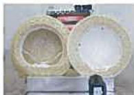
「熱ボウシ」あり測定