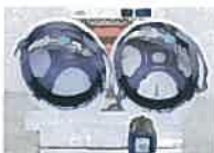
「熱ボウシ」あり測定