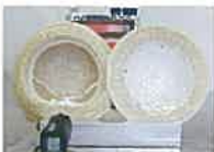
「熱ボウシ」なし測定